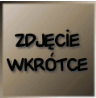
Hierodula majuscula 15.00 zÅ,