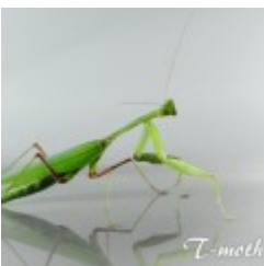
Hierodula membranacea 12.00 zÅ,