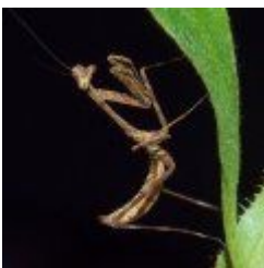
Pseudoempusa pinnapavonis 25.00 zÅ,

Modliszka oczkowa [SzczegÅ³Å,y produktu...]