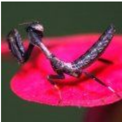
Popa spurca crassa 20.00 zÅ,