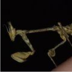
Gongylus gongylodes -