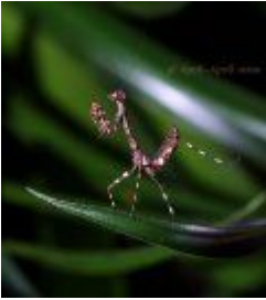
Deroplatys lobata 25.00 zÅ,