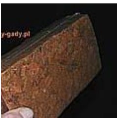
Chips kokosowy w brykcie 10.00 zÅ,

Sprzedajemy w opakowaniach po 5 litry. [SzczegÅ³y produktu...]