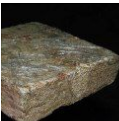
Brykiet prasowanego mchu z Chile 22.00 zŃ,

MaŃ, y 80 gram - taki jak na zdjŃ™ciu 22zŃ,/szt; duŃ¼y 200 gram 46zŃ,. DostŃ™pne: maŃ, y i duŃ¼y. [SzczegŃ³y produktu...]