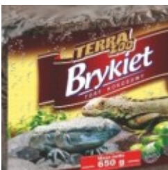
Brykiet prasowanego wŃ³kna kokosowego 8.50 zŃ,

MaŃ, y 80 gram - taki jak na zdjŃ™ciu 22zŃ,/szt; duŃ¼y 200 gram 46zŃ,. DostŃ™pne: maŃ, y i duŃ¼y. [SzczegŃ³y produktu...]