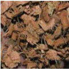
Chips kokosowy 12.00 zÅ,

Sprzedajemy w opakowaniach po 4 litry. [SzczegÅ³y produktu...]