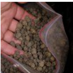
Ciemny keramzyt 9.50 zÅ,

PodÅ¼e do kaÅ¼dego typu terrariÅ³w. Po rozrobieniu z wodÅ... moÅ¼na z niego uzyskaÅ¼ ok. 9l chipsu kokosowego. [SzczegÅ³y produktu...]