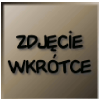
ReptiVit (Dolfos) 24.00 zÅ,

WapÅ,, dla gadÅ³w. [ SzczegÄ³Ä,y produktu... ]