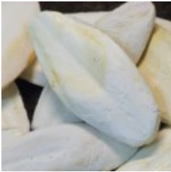
Sepia 3.50 zÅ,

Najdrobniej sproszkowane (najwiÅ™cej zatrzymuje siÅ™ na owadach karmowych) witaminy na rynku. Op. 200ml. [SzczegÅ³y produktu...]