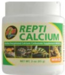
Repti Calcium 85g z D3 25.00 zÅ,

Z witaminÄ... D3 - Stosuje siÄ™ jako dodatkowy suplement dodajÄ...c do pokarmu. [ SzczegÄ³Ä,y produktu... ]