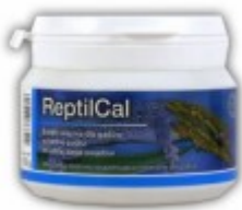
ReptiCal (Dolfos) 22.00 zÅ,

Z witaminÄ... D3 - Stosuje siÄ™ jako dodatkowy suplement dodajÄ...c do pokarmu. [ SzczegÄ³Ä,y produktu... ]