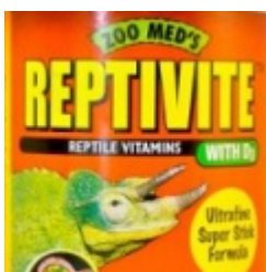
Reptivite - Zoo Med 28.00 zÅ,

Witamina dla gadÅ³w. [ SzczegÄ³Ä,y produktu... ]