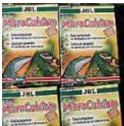
Microcalcium 100g JBL 38.00 zÅ,

Nanopuder :) wapienny renomowanej firmy idealny jako dodatek do witamin w okresie najszybszego rozwoju mÅ,odych gadÅ³w. [SzczegÅ³Å,y produktu...]