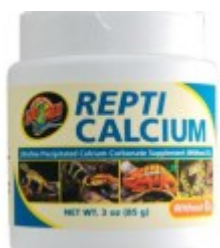
Repti Calcium 85g bez D3 22.00 zÅ,

Nanopuder :) wapienny renomowanej firmy idealny jako dodatek do witamin w okresie najszybszego rozwoju mÅ,odych gadÅ³w. [SzczegÅ³Å,y produktu...]