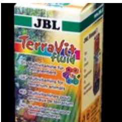
TerraVit Fluid 30.00 zÅ,

Kompleks witamin i mineraÅ³w dla gadÅ³w. Prawie dwukrotnie wiÅ™ksze opakowanie od standardowych witamin. [SzczegÅ³y produktu...]