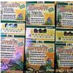
Terravit 100g JBL 38.00 zÅ,

Doskonale przyswajalny wÅ™glan wapnia. WiÅ™cej po klikniÅ™ciu na szczegÅ³y. [SzczegÅ³y produktu...]